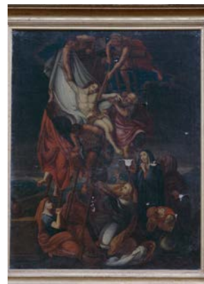
CUTS DÉPOSITION DE CROIX ET ADORATION DES BERGERS