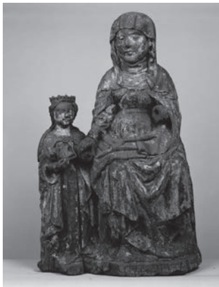
MORLINCOURT L'ÉDUCATION DE LA VIERGE