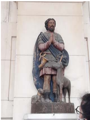
PONT-L'EVÊQUE SAINTS HUBERT ET CHRISTOPHE