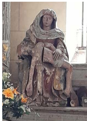
VILLE VIERGE DE PITIÉ